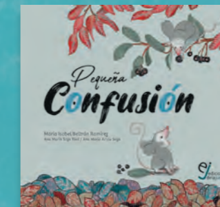
Pequeña confusión ISBN: 978-956-6013-32-7 Año 2022