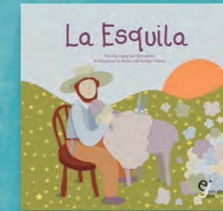
La esquila ISBN: 978-956-6013-24-2 Año 2019

La Colección Cuentos para el jardín nace del Concurso del Cuento Ilustrado, “Del juego a la palabra”, organizado por la Junta Nacional de Jardines Infantiles (JUNJI) para incentivar la producción literaria y promover la educación en los primeros años mediante la lectura y difusión de relatos que hayan sido creados para niños y niñas de 0 a 4 años de edad, sus familias y educadoras.